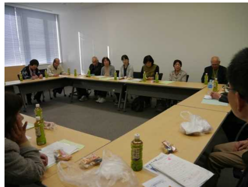
(観音寺地区交流会)