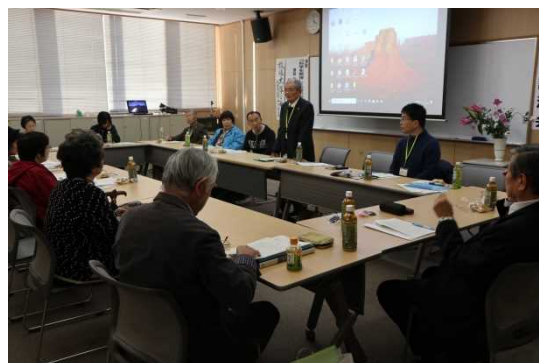
(東かがわ地区交流会)